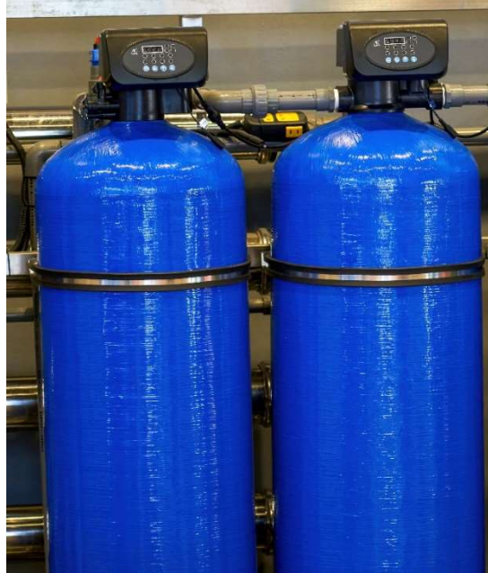
Hidropnömatik valfli sistemler