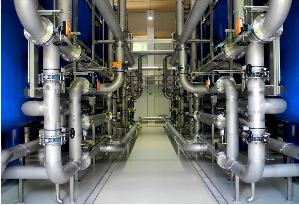
Yüzey borulamalı sistemler