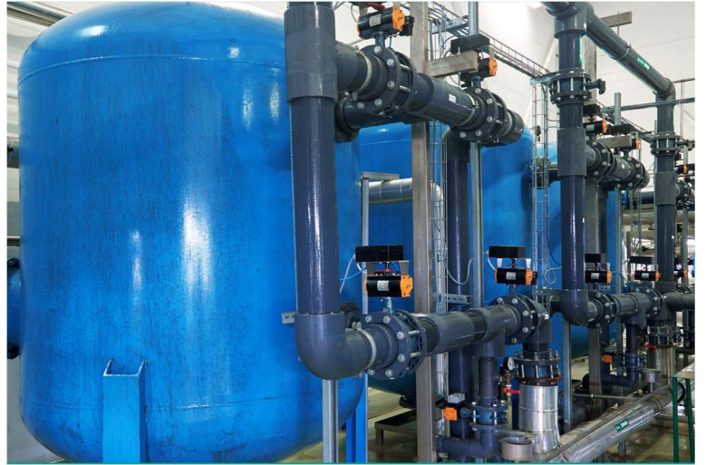
FRP Tanklı Sistem